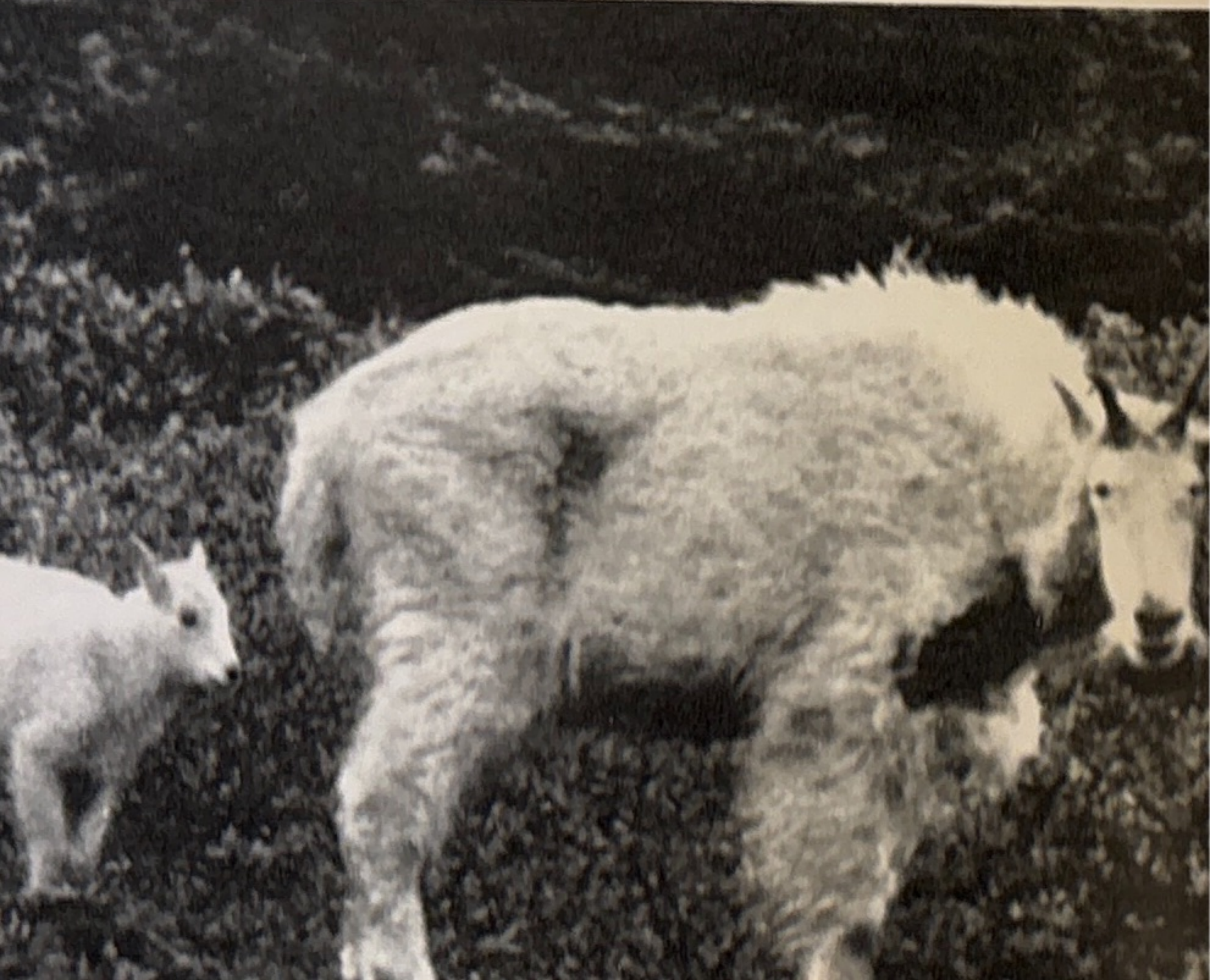
Snöget — bergsget — med kid.