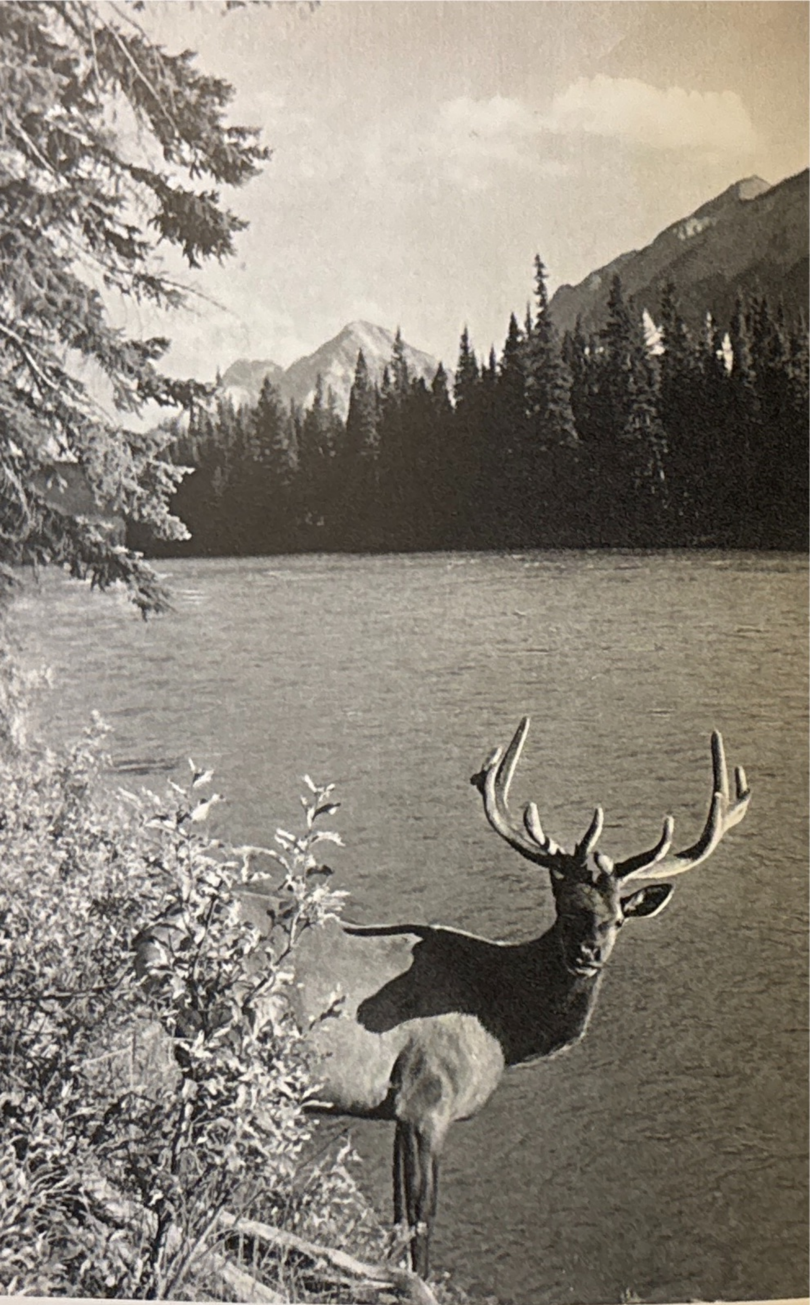
En vapiti-hjort — American Elk.