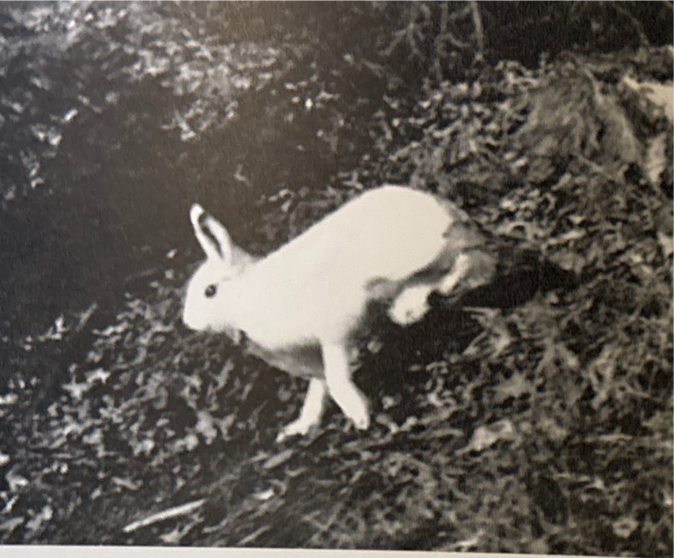
Hare i vinterdräkt på barmark.