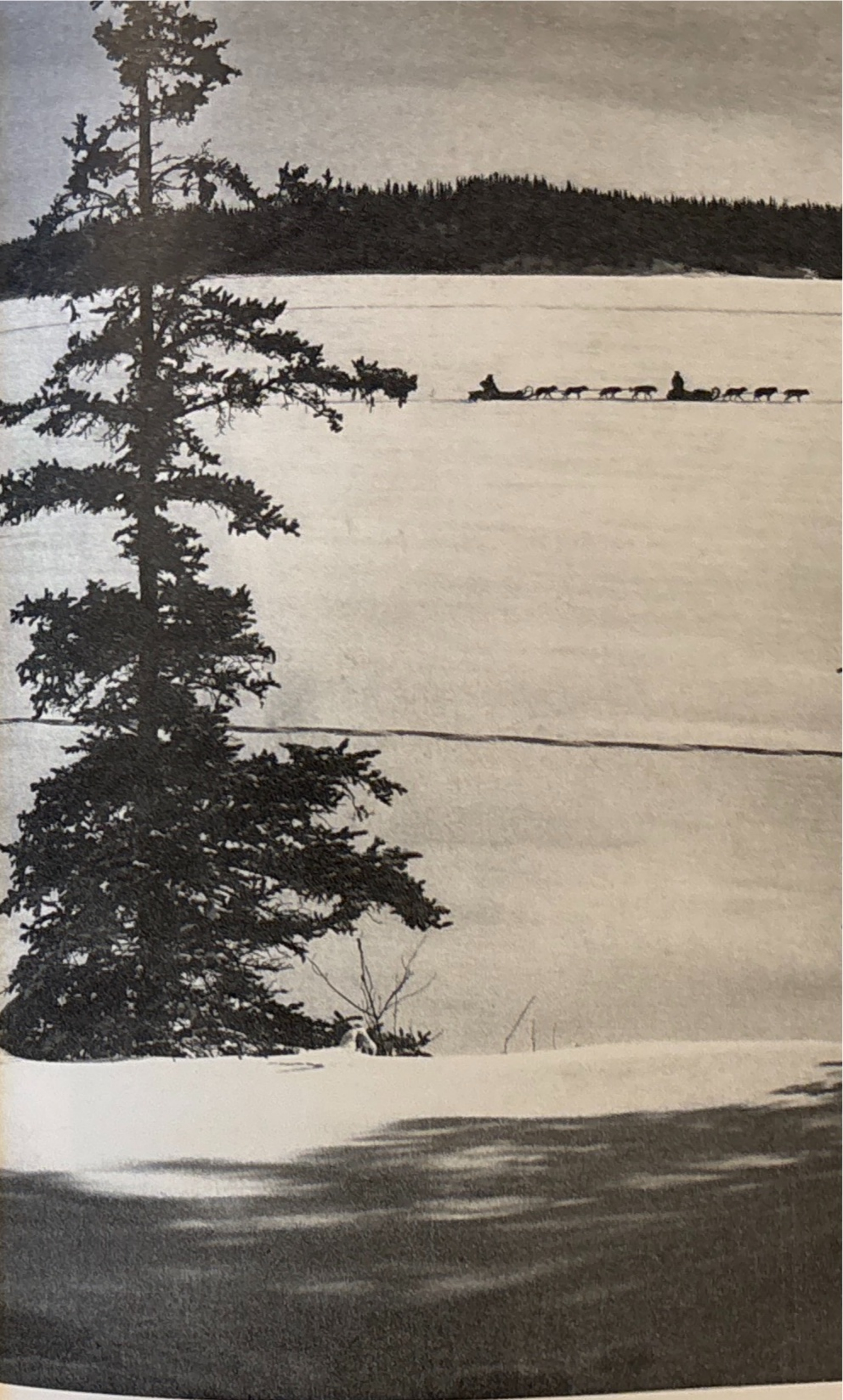
Hundspannen begagnas flitigt av trappers.