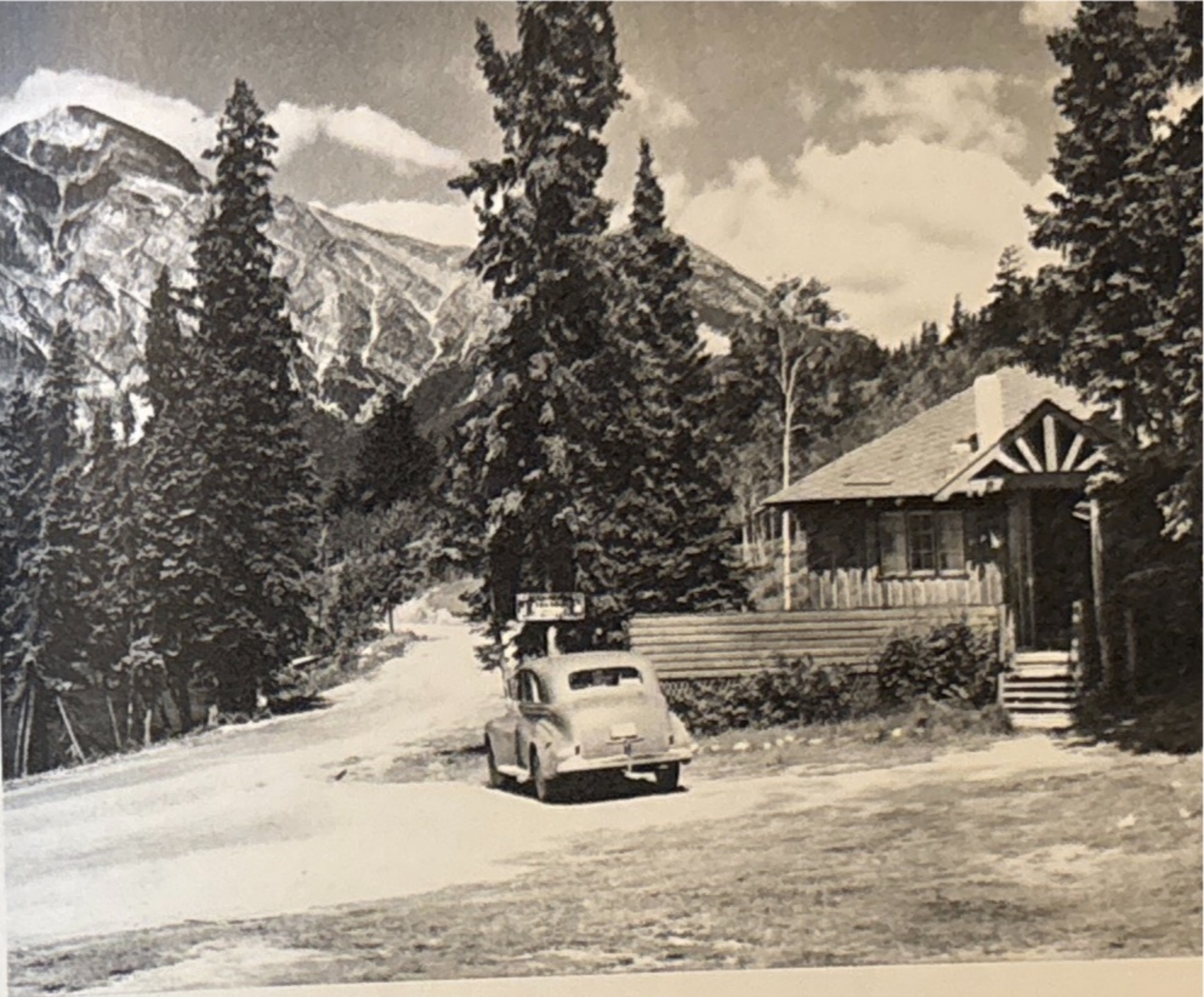
En av de många »cabins» i Jasper Park.

Knappt hade vi lämnat bilen förrän en björnfamilj tog sig en titt på den.